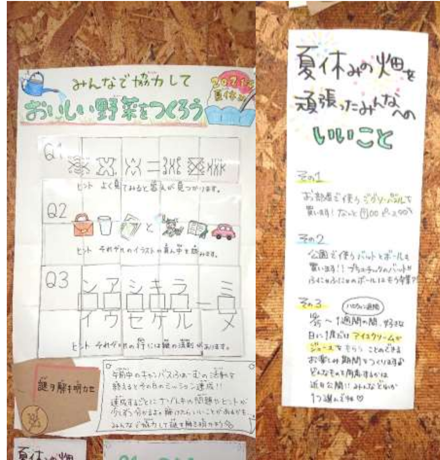
野菜謎解きゲーム 活動GOAL