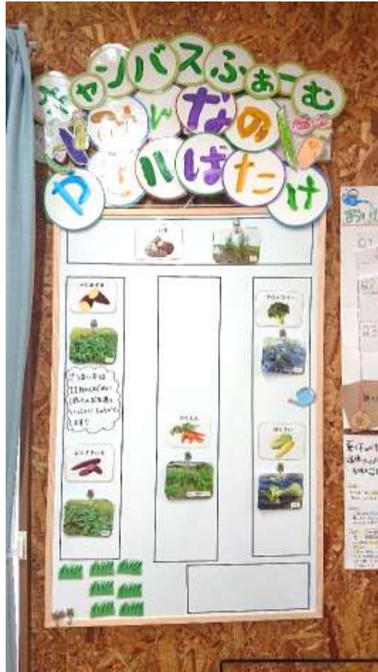
キャンバスファーム 活動パネル